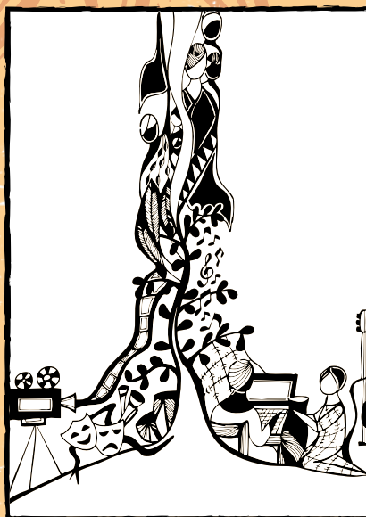
Ilustração: por Evelyne Medeiros