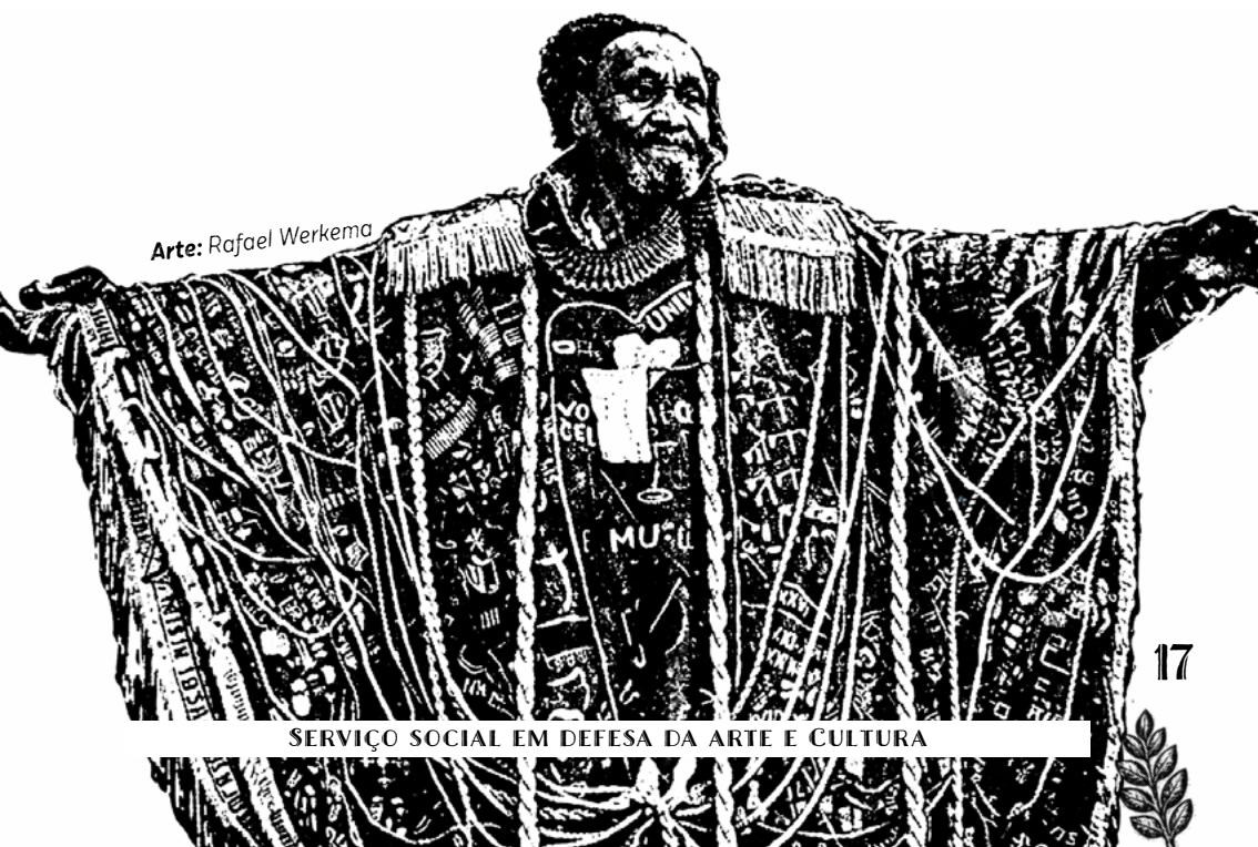
Arte: Rafael Werkema

Para isso, é sempre importante a elaboração de questões como: qual o objetivo dessa atividade? Que valores e afirmações estão presentes? O que, dito como arte e cultura, reforça (ou não) preconceitos e violências ou são manifestações emancipatórias?