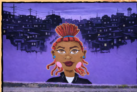
Grafite: A Periferia Tem Rosto de uma Mulher preta, por Sane