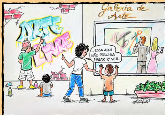
Charge: por Mindu Zinek